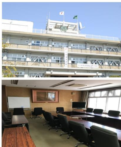
※出展ブース設置箇所の写真は一例となります。